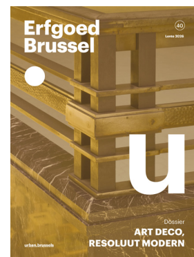
Erfgoed Brussel nr. 40 “Art Deco, resoluut modern” urban.brussels (binnenkort verkrijgbaar)