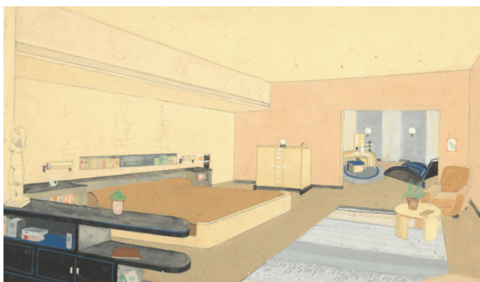
Baucher Feron