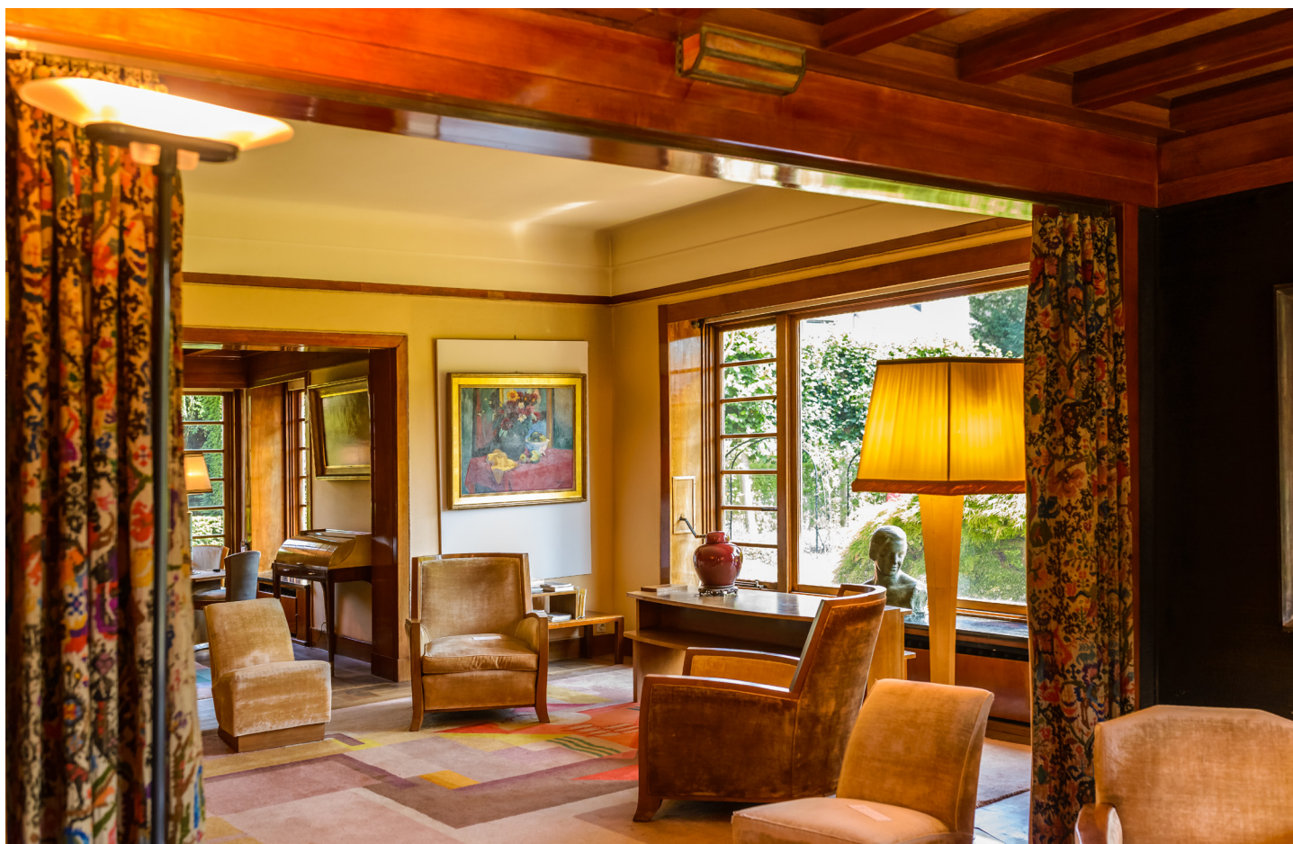
Van Buuren Museum & Tuinen, Jean-Paul Remy © visit.brussels

Dankzij hun omvang en lokale verankering zorgden al die activiteiten voor een evenwichtige spreiding van de programmatie in het hele gewest. Zo spraken ze een breder publiek aan en stimuleerden ze de samenwerking tussen cultuuroperatoren, verenigingen en lokale besturen.