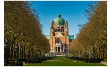
Jean-Paul Remy © visit.brussels

De Nationale Basiliek van het Heilig Hart , de vijfde grootste kerk ter wereld.