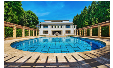
Jean-Paul Remy © visit.brussels