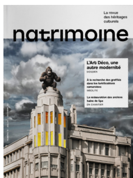
“L’Art Déco, une autre modernité” (Natrimoine n°10)