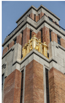
A. de Ville de Goyet © urban.brussels

Het gemeentehuis van Vorst , onlangs gerestaureerd en open voor het publiek.