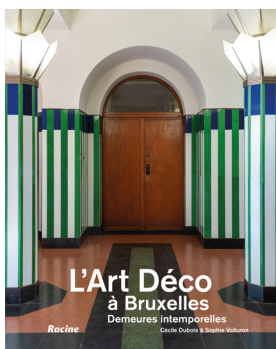
“L’Art Déco à Bruxelles - Demeures intemporelles” (Uitgeverij Racine)

Als terugblik op het bijzonder rijke Jaar van de art deco zal Urban het 40e nummer van zijn tijdschrift Erfgoed Brussel, dat begin 2026 verschijnt, volledig aan die stijl wijden. Het nummer gaat onder meer in op de grote uitdagingen bij de restauratie van twee beschermde blikvangers: het Palais de la Folle Chanson in Elsene en Les Pavillon français in Schaarbeek.