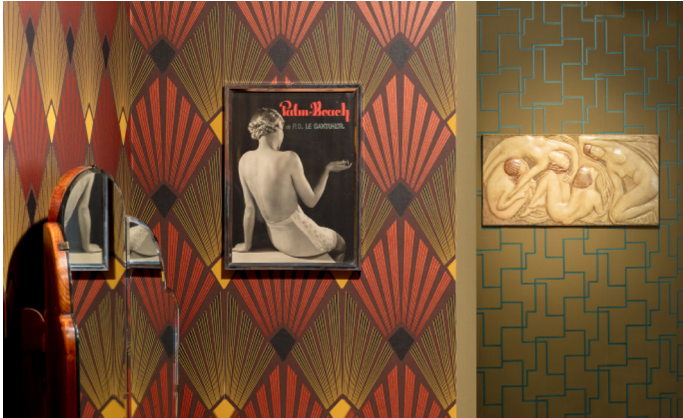
Echoes of Art Deco