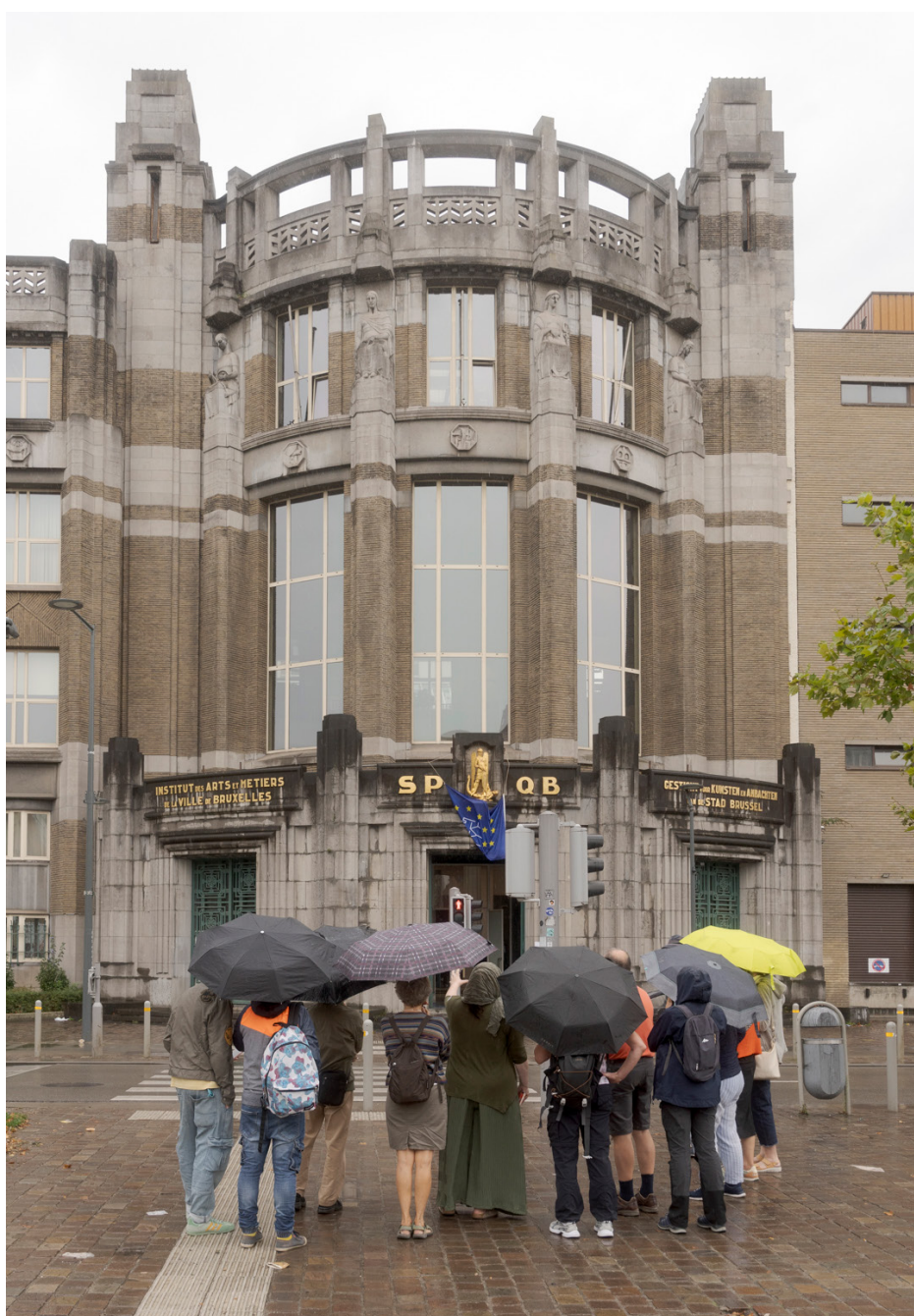
Heritage Days / Journées du Patrimoine 2025, Institut des Arts et Métiers, Jonathan Ortegat © urban.brussels

Danse, gastronomie et art de vivre ont également rythmé la programmation, avec des ateliers de Lindy Hop et de Solo Jazz, mais aussi des balades culinaires explorant les mutations sociales et les nouvelles pratiques de la table de l'époque. La culture brassicole bruxelloise a également été mise à l'honneur à travers expositions, rencontres et dégustations, soulignant le rôle central des cafés et brasseries dans la sociabilité et la vie quotidienne de l'entre-deux-guerres, tout en montrant comment cette période a contribué à façonner la culture belge de la bière, aujourd'hui reconnue pour sa richesse et sa diversité.