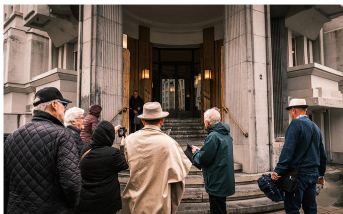
Brussels Post-Congress Art Deco 2025, Église Saint-Augustin

Conférence « La petite histoire d'une grande maison gantoise, la Compagnie Chantal »