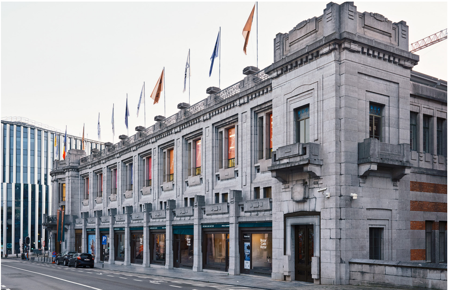
Façade Bozar, Philippe Braquenier © urban.brussels