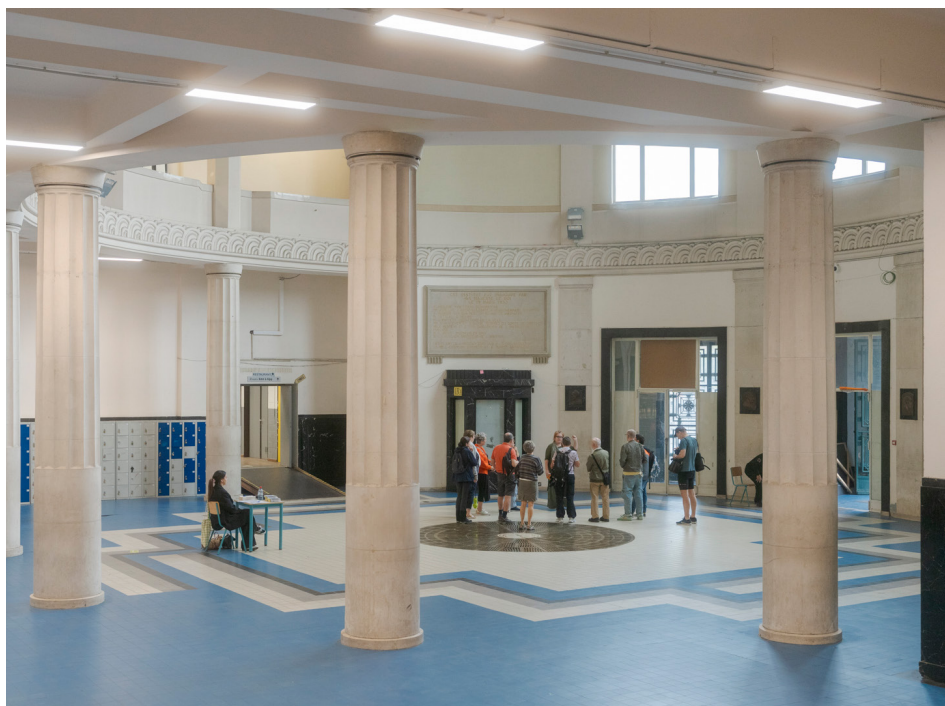
Heritage Days / Journées du Patrimoine 2025, Institut des Arts et Métiers, Jonathan Ortegat © urban.brussels

partenaires impliqués, parmi lesquels des musées, institutions culturelles, associations de guides, ambassades, communes bruxelloises et éditeurs.