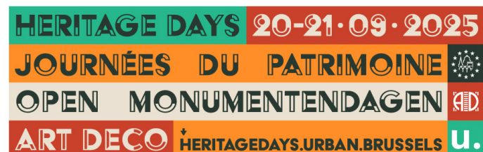
Illustration : Anne Brugni, Design : Julien Lelièvre © urban.brussels

en invitant les visiteurs à (re)découvrir l'héritage bruxellois de l'entre-deux-guerres à travers un large éventail de propositions : bâtiments, façades, intérieurs, mais aussi mobilier, collections, patrimoine immatériel et espaces publics.