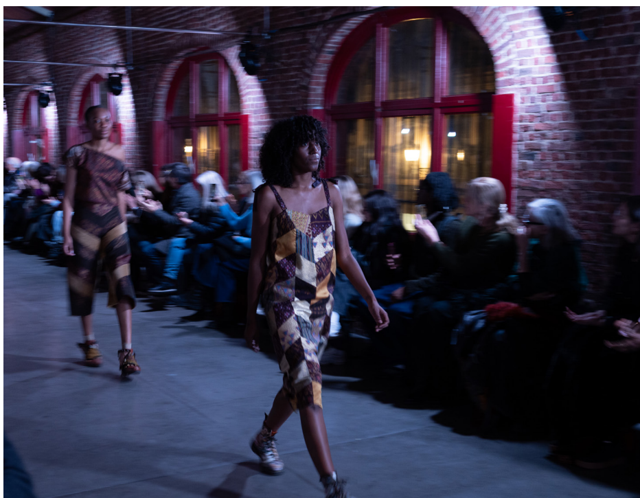
Défilé de clôture «Art Deco 1925 >< Mode 2025» (Julie Menuge)

Enfin, les espaces verts de l'entre-deux-guerres ont également été mis à l'honneur à travers le Printemps des Cimetières ( 285 visiteurs ) et les Garden Tales du CIVA ( 991 visiteurs ) tandis que le défilé de clôture de l'exposition Art Deco 1925 >< Mode 2025, proposant une réinterprétation contemporaine de l'esthétique vestimentaire de l'époque, a rassemblé plus de 400 personnes aux Halles Saint-Géry.