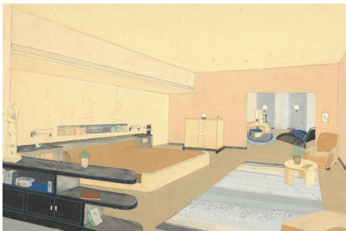
Baucher Feron © Design Museum Brussels